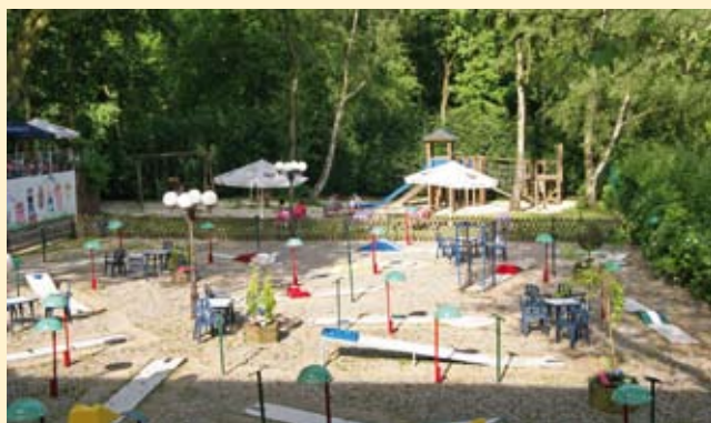
Spielplatz und Minigolfanlage