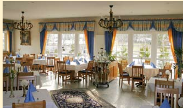
à la carte Restaurant

Dazu bieten wir eine gut sortierte Weinauswahl und unseren freundlichen und persönlichen Service.