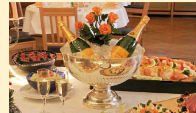
Von rustikal bis luxuriös